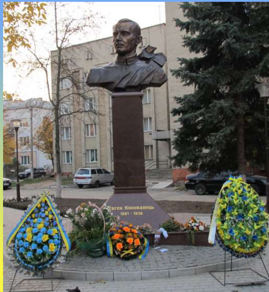
Пам'ятник Є. Коновальцю (м. Івано-Франківськ)