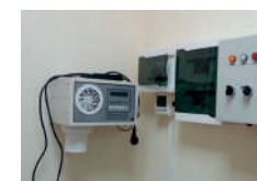
ПРОФЕСІЙНИЙ СОЛЯНИЙ ГАЛОГЕНЕРАТОР HALOPRIMA

Лазерна волоконно-оптична система галогенератора контролює та керує якісними факторами сольового аерозолу в режимі онлайн.